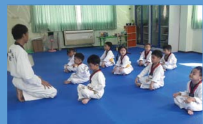
เทควันโด